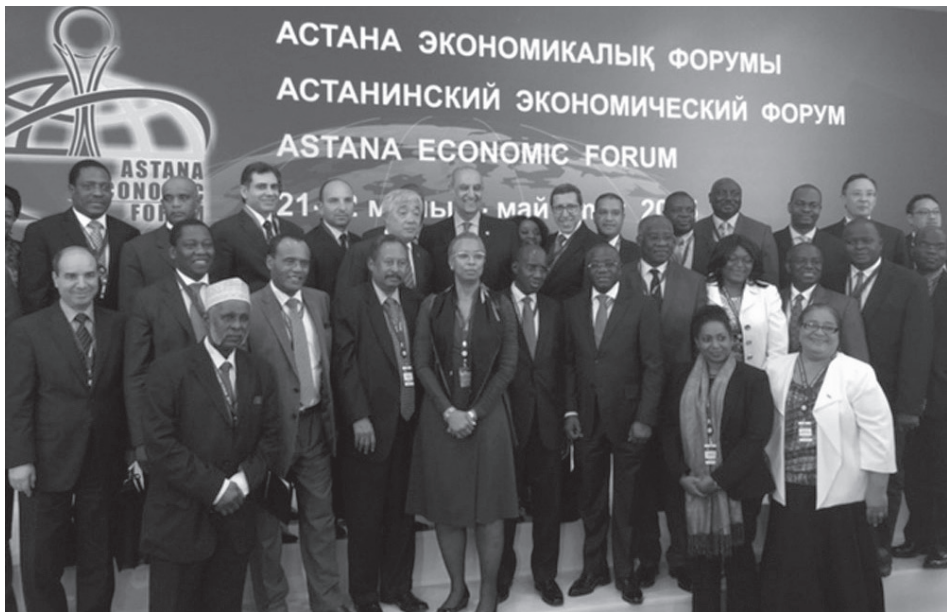
▲ Kép 2. A 2015-ös Astana Economic Forum „Afrika – a világgazdaság új gazdasági hajtóereje” kerekasztal résztvevői.

A következő időszakban az UNDP és a kazah külügy szakmai tudásfrissítő kurzusokat is szervezett az olaj- és gázkitermelés, közegészségügy 11 és mezőgazdaság különböző területein, 23 afrikai ország 90 résztvevője számára, mely kezdeményezés a 2015-ös Astana Economic Forum Afrika Paneljének eredménye. 12