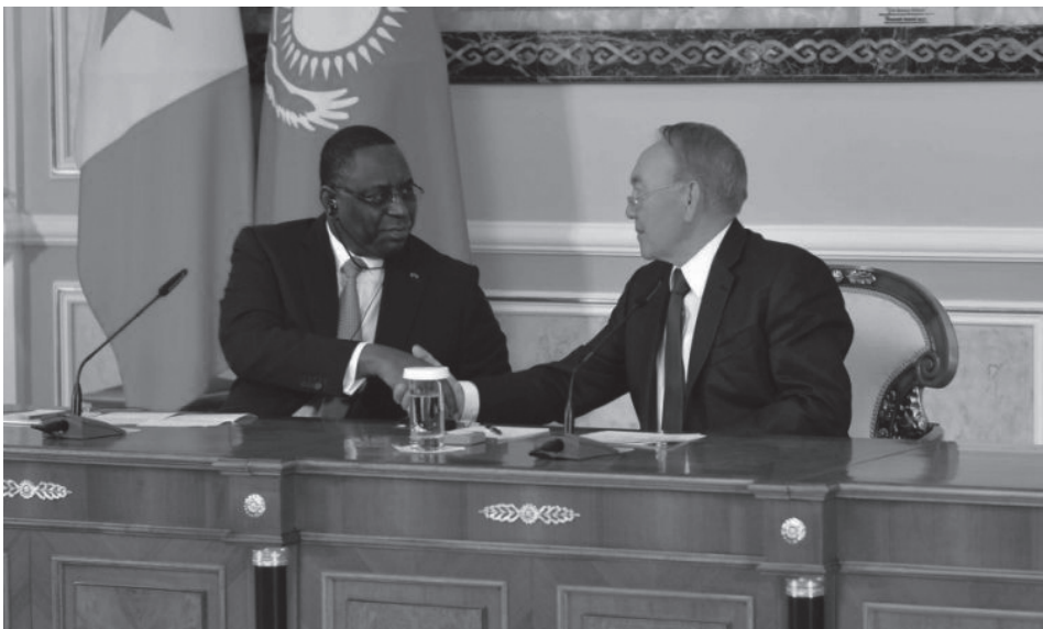
▲ Kép 1. Nazarbayev kazah elnök fogadja Szenegál elnökét, Macky Sallt 2016-ban az akkori Aszthanában, az elnöki palotában.

Kazahsztán bilaterális kapcsolatokkal rendelkezik olyan afrikai országokkal, mint például Dél-Afrika, Egyiptom és Etiópia, de az AU-ban megfigyelőként való részvétel további afrikai országokkal való kapcsolatfelvételt is lehetővé tett. A megfigyelő státusszal járó előnyök Kazahsztánnak új lehetőségeket nyitottak meg az afrikai országokkal a kereskedelmi és gazdasági kapcsolatok kölcsönösen előnyös fejlesztésére, 8 és segítik Kazahsztánt külpolitikai kezdeményezéseinek előmozdításában, például a béketörekvései megerősítésében a nemzetközi közösség regionális és globális biztonságán keresztül.