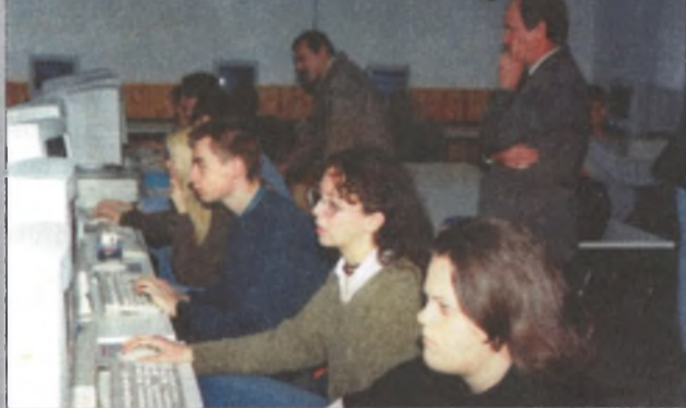
A fertődi Porpáczy Aladár Kertészeti Szakközépiskola korszerű informatikai rendszere

Amióta az iskola tanulói birtokba vették a számítógépeket, azok szinte folyamatosan – tanórák alatt és azokon kívül is – használatban vannak. A tanulók szakmai fejlődése folyamatos, töretlen, így sok örömmre ad okot az iskola valamennyi oktatójának. Az sem mellékes, hogy a fejlesztés óta a fertődi gimnázium eszközparkja egy diákra vetítve kedvezőbb arányokat mutat, mint az osztrák testvériskoláé. Úgy tűnik tehát, hogy e határon átnyúló oktatási együttműködéssel a fertődi iskola immár az Európai Unió kapujában érezheti magát.