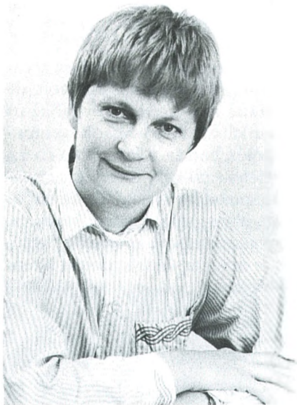
Mizsei Zsuzsa, a Kereszténydemokrata Néppárt alelnöke

Feltétlenül szüksége lenne egy olyan profi szakértőkből álló csapatra, amely kívül és belül képviselné az országimázst, kialakítaná és fenntartaná azt, és némileg korrigálná a politika esetleges ballépéseit – nyilatkozta Mizsei Zsuzsa, a KDNP alelnöke.