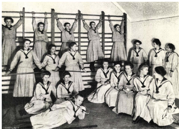
10. kép – Lányok a tornateremben

A forrásfeltárások egyértelműen mutatják, hogy a 19. század második felének magyar sajtó- és könyvkiadása növekvő számban közölt a lányok testi nevelésével és egészségvédelmével kapcsolatos írásokat. Ezek egy része a külföldi testi nevelés eredményeit, fejleményeit mutatta be. Az innovatív gondolatok mellett sok volt közöttük a lánytestnevelés elhanyagolásával, a divat szélsőséges és egészségre ártalmas kinövésével kapcsolatos kritika is. A leányiskolai testnevelés Magyarországon főként városi környezetben kezdett