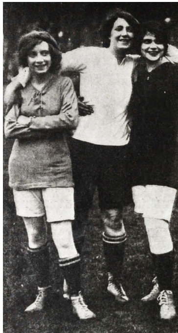
11. kép – Futballozó angol színésznők

1914-ben a Tolnai Világlapja már arról írt, hogy a nők az olyan nehéz sportágakat is úzik, mint a birkózás, futás, futballozás, ez utóbbiról írva fotóval illusztrálva jelezték, hogy Angliában már meccset is rendeztek nőknek, igaz, hogy „ egyelőre csak a – mindig függetlenebb – színésznők vettek részt benne. ” 103