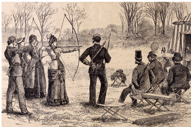
7. kép – Nyilazó társaság

A vívást gyakorló hölgyeknél is kevesebb kiváltságos nő vehetett részt a főúri vadászaton. A Vasárnapi Ujság című hetilap 1880-ban kuriózumként közölte a hírt a francia hölgyek körében akkoriban terjedő időtöltésről. 63 A lapban egy férfi még 1909-ben is gúnyolódva és lekicsinylően szólt a női vadászokról, akiknek szerinte még elnevezést sem lehet találni, olyannyira alkalmatlanok e „sport” művelésére. Szerinte a nők hiába vadásznak, mert nem értenek az effélékhez; soha nem tudnak csendben maradni; nincs bennük szenvedély; alkalmazkodásra hajlóak; csak a fess vadászuha érdekli őket; nem mennek el egyedül vadászni; azt sem bánják végeredményben, ha elmarad a vadászat. 64 A főúri körök nőtagjai azonban részt vettek a vadászaton, miként ezt például Izabella főhercegnő újságokban is gyakran közölt fotói mutatják. 65 Nyilazó hölgyekről is láthatunk olykor újságképeket. 66