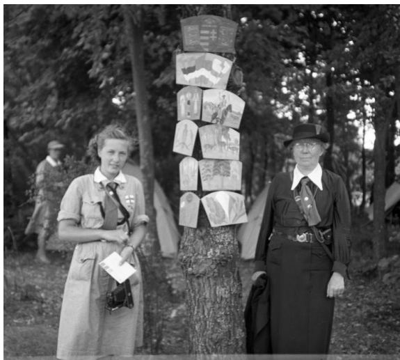
4. kép – Cserkészek a Pax Tingen 1939-ben

Bár a mozgalom Magyarországon csak lassan bontakozott ki, anyagi problémákkal küzdött, és a katolikus egyház mellett a Magyar Cserkészszövetséggel sem volt mindig felhőtlen a viszony, a külföldi diplomácia terén a magyar vezetés mégis nagy sikereket ért el. Parádát választották ugyanis az ötödik világkongresszus helyszínéül. Ezen a rendezvényen – amelyen a Baden-Powell házaspár is megjelent – alakult meg a Cserkészleány Világszövetség (1928). 15 Ennek vezetősége, az ún. Nemzetközi Kilences Elnöki Tanács tagjai közé pedig bekerült a magyar szövetség országos elnöke is. 16 1939-ben ismételten Magyarország, mégpedig újra Gödöllő nyújtott helyszínt nemzetközi cserkészeseménynek: a Pax Ting, azaz Békegyűlés névre keresztelt tizedik cserkészleány világjamboree-nak (4. kép). 17