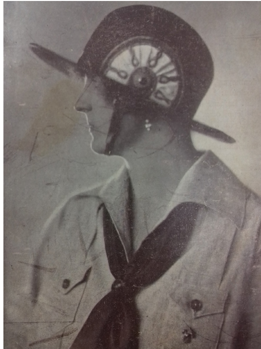
3. kép – Anna főhercegnő

A pártfogók és a nemzetközi szervezet vezetőinek közbenjárása ellenére a szövetségnek nem sikerült elérnie a magyar katolikus egyház támogatását: a püspöki kar még 1926-ban betiltotta a leánycserkészteket a katolikus iskolákban. Nem tartotta ugyanis elég erősnek a mozgalmon belül folyó valláserkölcsi nevelést, valamint féltette saját ifjúsági egyesületeinek sikerét. Pedig a leánycserkészteket – a fiúkéhoz hasonlóan – felekezeti alapon állt, elvárta a tagok aktivitását a saját felekezetüknek megfelelő vallásgyakorlást illetően. 8 A katolikus egyház ellenzése csak lassan csökkent. A tilalmat 1934-ben függesztették fel. Bizonyos feltételek teljesüléséhez, mint például „a női lélek igényei”-hez való igazodáshoz azonban ezután is ragaszkodtak. S az egyházon belül továbbra is voltak olyanok, akik helytelenítették – vagy legalábbis aggodalommal kísérték – a lányok cserkészkedését. 9