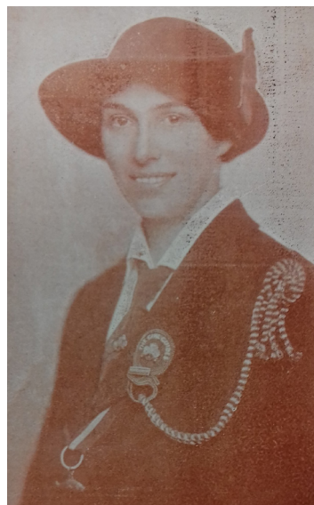
1. kép – Olave Baden-Powell

Még 1910-ben a fiúk londoni központjában megnyílt a leánycserkészek saját irodája. 1914-ben pedig Girl Guides Gazette címmel önálló lapot indítottak. 1915-ben a leánycserkész-szövetséget a brit kormány hivatalosan is elismerte. 1919-ben szervezték meg a Nemzetközi Bizottságot, amelynek irányításával ezt követően megrendezésre kerültek a leánycserkészet ügyeivel foglalkozó nemzetközi konferenciák (az első 1920-ban) és a lányok világjamboree-i (az első 1924-ben Foxlease-ben). Az ötödik konferencián (1928) 26 ország közreműködésével megalapították a cserkézlányok világszervezetét. 1932-ben megnyitotta kapuit Adelbodenben (Svájc) az Our Chalet , a lányok táborozási központja, amely adományokból épült fel. 4