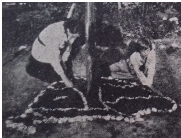
8. kép – Zászlóárbóc kertecskéje

togató útjáról, valamint új csapatok megalakulásáról is. 52 1928 karácsonyától kezdve a szövetség kezdeményezésére a cserkészlányok saját forrásból, illetve támogatásokból babakelengyét tartalmazó vándorkosarakat állítottak össze, amelyet évente ünnepség keretében nyújtottak át a rászoruló édesanyáknak. 53 Minden egyes számban közölték a szövetség boltjában kapható áruk jegyzékét is.