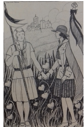
7. kép – Cserkészbarátság

Három szám címlapján cserkész vonatkozású rajzot találunk. Az 5. szám elején (lásd 5. kép) egy egyenruhás lány egy rózsabokor virágjában gyönyörködik, kezében locsolókanna, a közeli fán madáretető. A rajz egyértelműen a természet szeretetének, óvásának kötelességét megfogalmazó hatodik törvényre utal. A 6–7. szám címlapján (lásd 6. kép) táborozó lányokat láthatunk: a legidősebb az elkészült ételt kóstolja, a kisebbek kíváncsian várják az eredményt. A 8–10. számban a Cserkészbarátság című kép (lásd 7. kép) egy magyar és egy német cserkészlányt ábrázol, amivel a nemzetközi cserkésztestvériség fontosságára hívták fel a figyelmet. Mindhárom rajz készítője Molnár Rózsi, aki a lap illusztrátorának tekinthető. A fejlécek és a záróképek is az ő keze munkái voltak. A számos