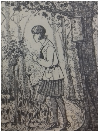
5. kép – Május

A lap minden esetben képpel kezdődött. A képek egy része fotó, a mozgalom külföldi vagy magyar vezető személyiségeit vagy hozzájuk kötődő személyt (Anna főhercegnő egyik leánya tündérkeként) ábrázol. A 3. szám címlapján – kivételként – Petöfi Sándor látható, akinek a Ki a szabadba című versét is közölték. 40 Miközben tehát utalás történt az 1848. márciusi 15-ei forradalomra, amit ekkor már az iskolákban is megünnepeleek, egyben egy tipikus cserkésztema, a természetszeretet is felbukkant. A 11. szám címlapján Szent Erzsébet, a 12. számén pedig Szűz Mária látható a kis Jézussal, ami a hit fontosságát mutatja a cserkészek számára, bár hozzátehetjük, ez a téma önállóan nem került elő a lapban.