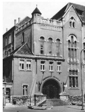
3. kép A Pécsi Pedagógiai/ Tanárképző Főiskola épülete

Az 1970-es évektől lettek stabilak az oktatási keretek, megszilárdult a négyéves kétszakos képzési struktúra. A pécsiek által „Pedfő”-nek nevezett intézmény országosan elismert pedagógusképző műhellyé vált. (3. kép) Ennek ellenére folyamatos volt az igény a bölcsészkar újjászervezésére. Az egyetemi hagyományokat a jogi kar tartotta ébren: 1967-ben nagy országos rendezvénnyel emlékeztek meg az 1367-ben alapított, első magyar egyetemről. Felmerül a kérdés, hogy pótolta-e a főiskola a bölcsészkar hiányát. A kérdésre egyértelmű nem a válasz. Számos példa van arra, amikor maguk a főiskolai oktatók küldték el legjobb diákjaikat, hogy valamelyik egyetemen fejezzék be tanulmányaikat. Az 1970-es évektől az oktatói gárdában azonban – elsősorban egyéni ambíciók nyomán – kimagasló kutatói teljesítmények is születtek. A „Pedfő” alkalmassá vált arra, hogy egyetemi kar szerveződjön és épüljön rá.