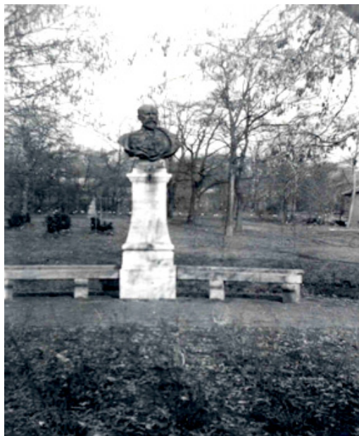
4. kép Bereczki Máté mellszobra, az elsőként felállított szobor a Budai Arborétumban (1930-as évek)

A mai BCE Budai Campus területén az első szobrot 58 – Mayer Ede 59 alkotását, Bereczki Máté 60 emlékének tisztelegve – 1897. április 17-én avatták fel. 61 (4–5. kép) Bereczki a tudományos alapokon nyugvó gyümölcsstermesztés és -nemesítés megteremtője, kiemelkedő színvonalú tudományos ismeretterjesztő munkák megalkotója volt. Bereczki Máté Entz Ferenc kortársaként, vele szoros tudományos kapcsolatot tartva a 19. századi magyar kertészeti termesztés és az ekkor születő magyar kertészeti tudomány máig ható munkásságát magáénak tudható alakja.