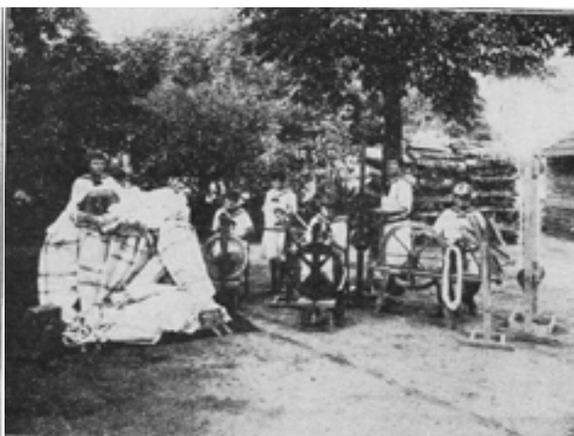
6. kép Vetőfonál készítése