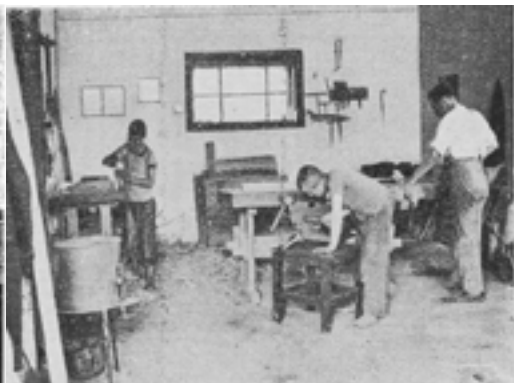
4. kép Asztalos műhely

szervezése idején szükségesnek mutatkozott az elméleti képzésben részesített növendékek foglalkoztatására külön foglalkoztató terület és épület létesítése is. Az intézet így a konyha-, virágkertészeti és a mezőgazdasági munkák részére külön földterületet bérelt. 1934 őszén fölavatták a külön telken épült, mintegy 30 növendéket befogadó munkateremmel ellátott foglalkoztató épületet, mely azt a célt is szolgálta, hogy az egyes családokhoz munkásnak kihelyezett növendékek munkanélküliség vagy betegség esetén is „otthonra találjanak”, és az újabb alkalmazásukig foglalkoztatást tudjanak biztosítani számukra. Az intézet jelentős állatgazdasággal (tehenészettel, sertés- és baromfitenyéssel) is rendelkezett, amely az intézet hús- és tejszükségletét csaknem teljes egészében fedezni tudta. Emellett – ahogy említettük – asztalos- és cipész-, valamint háziipari üzem is működött. Ez utóbbiban – főképp télen – szalma-, gyékény-, tengerihéj-lábtörőket, szőnyegeket és seprűket készítettek. A tanulók ezirányú munkatevékenysége helyhez kötött volt, huzamosabb ideig tartó, irányított munkát igényelt. Az intézet konyha- és virágkertészete, valamint a mezőgazdasága üzleti szempontból is jelentősnek bizonyult.