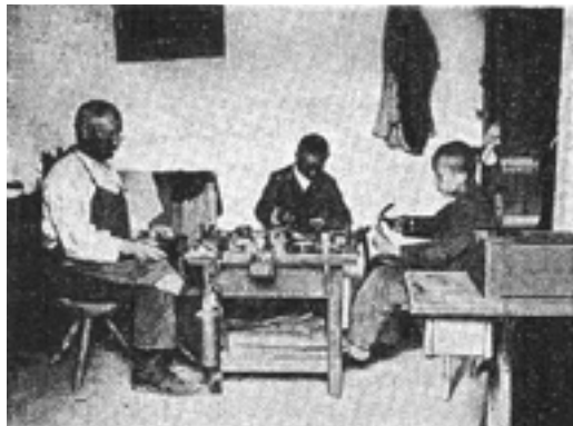
3. kép Cipésműhely

Az intézetben a pedagógusok az elméleti órákkal párhuzamosan napi kerti, mezőgazdasági és állatgondozáshoz kapcsolódó tevékenységek által készítették fel tanulóikat a munkára. Az 1929/30-as tanévben 65 növendék az intézet tulajdonát képező „4 és 23 bérelt kisholdon” konyhakerti, mezőgazdasági és állattenyésztési oktatásban részesült, két-két növendék pedig cipész- és asztalosműhelyben végzett munkát. 18 (3–4. kép) Már az intézet