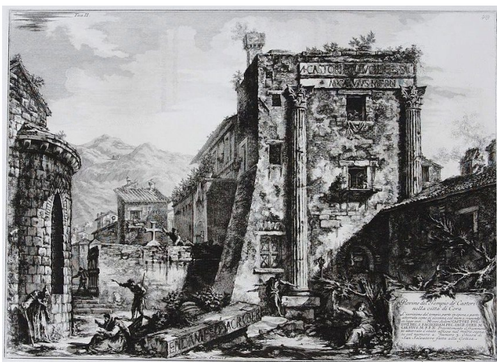
5. kép Giovanni Battista Piranesi: Rovine del Tempio de' Castori nella citta di Cora (A Castor és Pollux templom Coriban)

művek találhatóak meg közöttük, például Utagava Hiroshige A Tókaidó ötvenhárom állomásának képei , valamint Kacusika Hokusai A Fudzsi-hegy száz látképe és a Hokusai manga című világhírű sorozatai. 25 A lehetőfinom japán papírra tökéletes rajzi és technikai tudással kivitelezett, finom színátmenetekben bővelkedő lapok máig tiszteletet ébresztenek, noha egy nyugati kultúrkörből érkező szemlélő számára az ábrázolt állatok és növények szimbolikája, sajátos jelentése nem egykönnyen megfejthető. (6. kép) A gyűjteményegység magyarországi viszonylatban is igazi kuriózum, hiszen a Szépművészeti Múzeum ilyen típusú vásárlását jelentősen megelőzve, már a 19. század utolsó két évtizedében beszerzett az Országos Magyar Királyi Mintarajztanoda és Rajztanárképezde japán eredetű műveket, melyeket valószínűleg az ornamentika, később pedig a grafikai technikák oktatása során használhattak fel mintaként. 26 A gyűjteményegység feldolgozását Koike Masatane nyugalmazott egyetemi professzor kezdte meg, majd Máté Zoltán 27 és munkatársai, később pedig Bincsik Mónika művészettörténész folytatta a munkát.