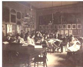
3. kép A férfi növendékek olvasóterme egykor kiállítások helyszíneként is funkcionált

Magyar Képzőművészeti Főiskolán 1921–1929 című kiállításon.