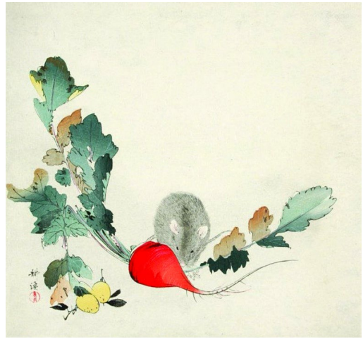
6. kép Cukioka Kójo: Patkány retekkel. Meidzsi-kor második fele

Az optikával, perspektívával, mozgásillúzióval foglalkozó tárgyi emlékek és dokumentumok körébe sorolhatjuk az 1921 előtt vásárolt, perspektívával foglalkozó több mint száz könyvet, a mozgásillúzió tanulmányozása kapcsán beszerzett vagy készített képeket, eszközöket, ismertetőket, végül, de nem utolsó sorban az optikai látványosságokat. 31 Ez az emlékcsoport minden bizonnyal Székely Bertalan ilyen irányú érdeklődésének köszön-