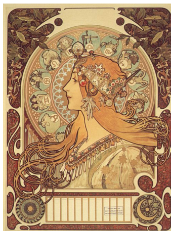
7. kép Alfons Mucha: Zodiaque (Naptárlap a La Plume folyóirat számára, 1896)

A Magyar Képzőművészeti Egyetem Művészeti Gyűjteménye hosszú évtizedek áldozatos munkájával jött létre, ma is élő, gyarapodó egysége az intézménynek, amelyet a tanszékek rendszeres – hallgatói munkákból álló – adományai is biztosítanak. Munkatársai továbbra is fontos feladatuknak tartják az egyetem műhelyeiben folyó oktatómunka dokumentálását és megőrzését az utókor számára.