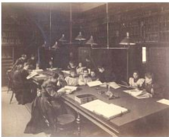
2. kép A női növendékek számára fenntartott olvasóterem

A mintarajziskola mellett – mely kizárólag az alapképzésre szorítkozott – jöttek létre a mesteriskolák; előbb a Münchenből hazahívott Benczúr Gyula vezetésével 1882-ben az I. számú Festészeti Mesteriskola, majd 1897-ben a II. számú Falképfestészeti Mesteriskola Lotz Károly irányításával, valamint a Stróbl Alajos által igazgatott Szobrászati Mesteriskola. Ezeket az önállósággal bíró, művészképzésre szakosodott intézményeket 1908-ban összevonták a mintarajziskolával Képzőművészeti Főiskola néven, így könyvtárunk is gyarapította a gyűjteményt.