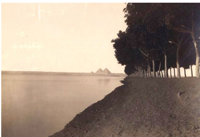
8. kép Luigi Fiorillo: Caire – L'Allée des Pyramides (1880 k.)