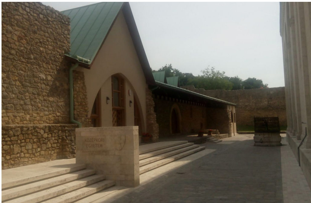
3. kép – Az ún. középkori pécsi egyetem épülete

Az előzőekben vázolt folyamatok nyomán merül fel a kérdés, hogy vajon Pécsen miért lett volna szükség már az alapításkor egy önálló egyetemi épületre? Bizonyára rendelkezésre álltak az egyetemi gyakorlatok, előadások számára megfelelő helyiségek a püspökváron belül, azt tehát véleményem szerint erősen kérdéses, hogy Vilmos püspök az egyetem