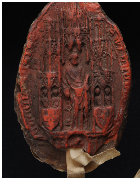
2. kép – Vilmos püspök pontifikális pecsétjének lenyomata