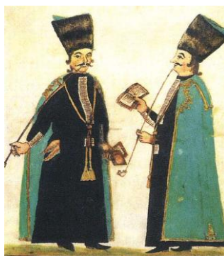
Forrás: Barta, 1997, p. 54.

4. sz. kép: Debreceni diákok Csokonai József, a költő édesapjának rajzolatában 1789 előtti viseletben