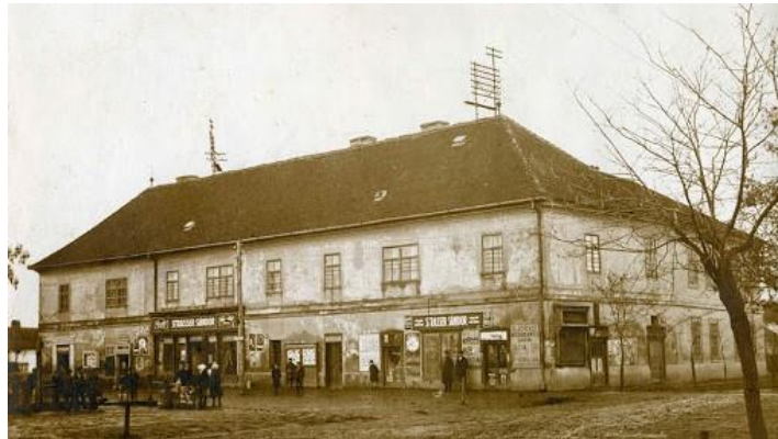
Forrás: Újszállási Rácz, 2018, p. 87.